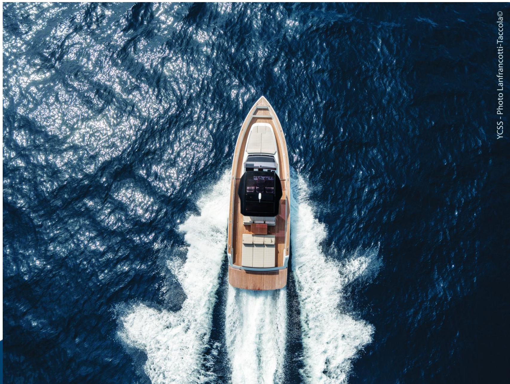
YCSS - Photo Lanfrancotti-Taccola©